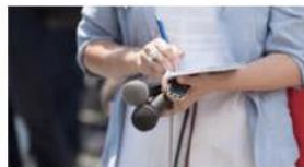
Frågor och svar om hat och hot