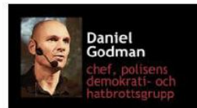
Att göra polisanmälan