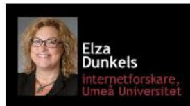
Så hanterar du näthatet